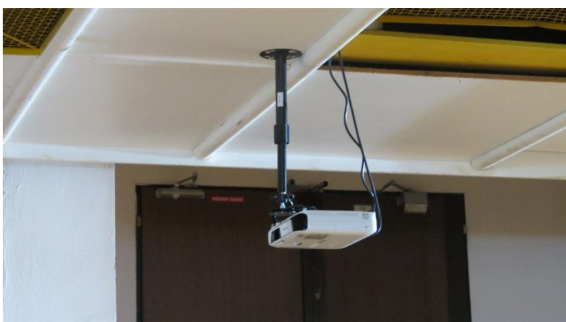
Projektor nainštalovaný do telocvične detail