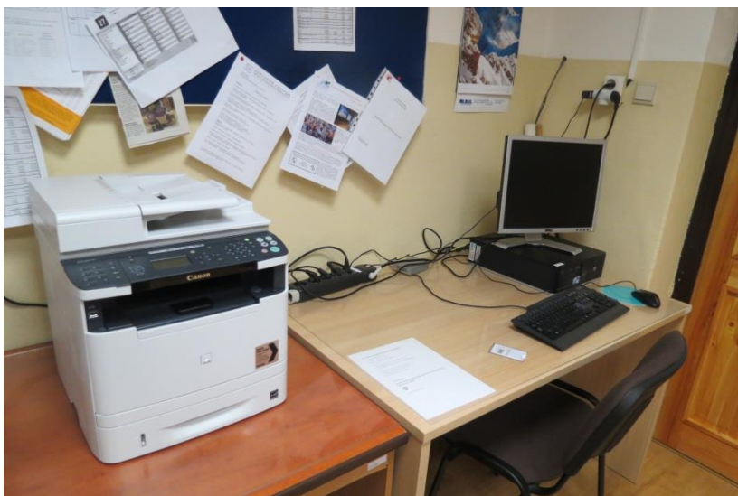
Tlačiareň umiestnená v zborovni na prípravu učebných materiálov pre žiakov školy