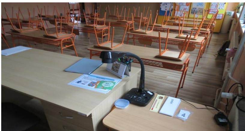
Vizualizér do triedy 1. Stupňa